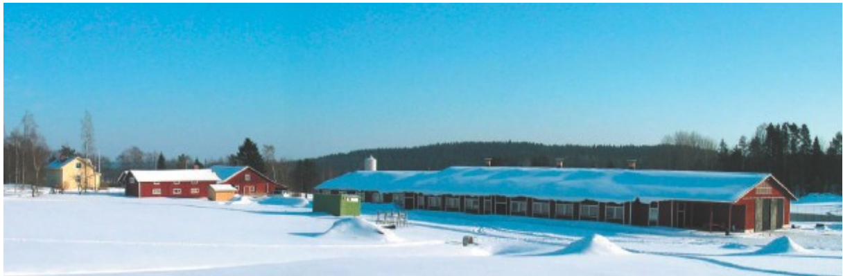
[Maatilan talouskeskuksen toiminnallinen ja maisemallinen suunnittelu] MTT 2005

L'utilisation de la modélisation virtuelle est une nouvelle pratique qui permet aux concepteurs de présenter des projets de constructions dans leur environnement. C'est une technique de photomontage qui met en oeuvre des programmes de conception assistée par ordinateur et des photographies numériques. Utilisée par les projeteurs, les maîtres d'ouvrages et les autorités, cette technique constitue une méthode simple et rapide pour juger de l'inscription dans l'environnement des constructions nouvelles.